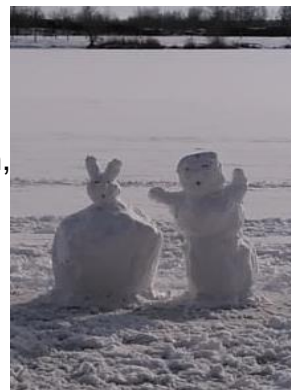
Schneemänner auf dem Pockinger Baggersee